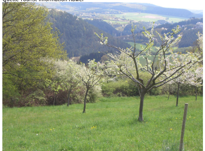
Streuobstwiese mit Fernblick