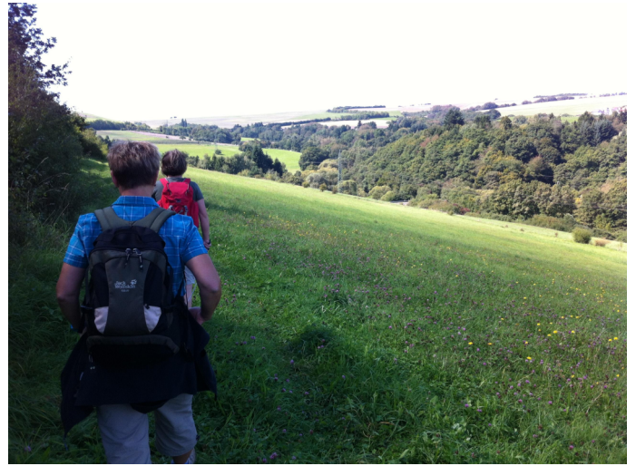
Bei Pluwig Autor Tourist-Information Ruwer Quelle Tourist-Information Ruwer