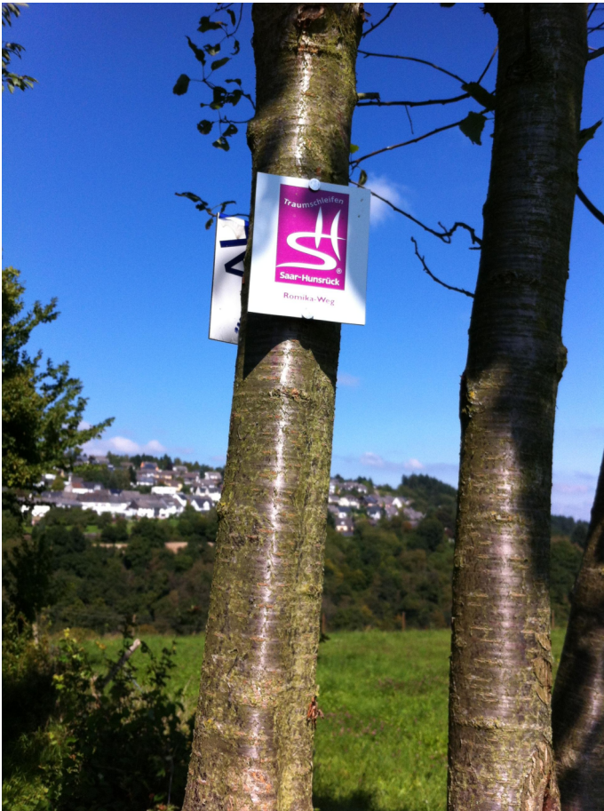
Blick auf Gusterath