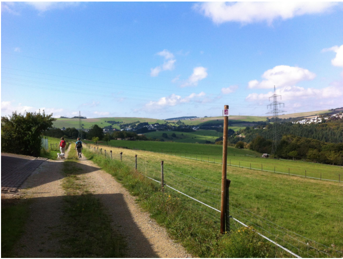
Blick auf Pluwig und Gusterath Autor Tourist-Information Ruwer Quelle Tourist-Information Ruwer